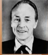
From World Book © 2004 World Book, Inc. 113 N. Michigan Avenue, Suite 2000, Chicago, IL 60601. All rights reserved. AP Photo Book